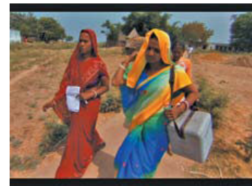
Em uma cena do curta The Final Inch , integrantes da equipe de imunização transportam a vacina na Índia.

O Dia Mundial da Pólio homenageia Jonas Salk, que nasceu em 28 de outubro e desenvolveu a primeira vacina antipólio.