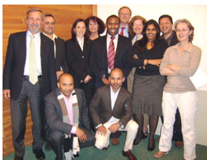
O presidente do clube Andro Bottse (em pé no centro) com sócios do Rotary Club de Amsterdam-Arena

O Rotary International reconhece o valor da diversidade no quadro social dos clubes e os incentiva a buscar em suas comunidades sócios potenciais de diferentes grupos étnicos, religiosos, políticos, etc. Um clube que reflete a constituição demográfica e profissional da região é um clube que possui a chave para o futuro.."