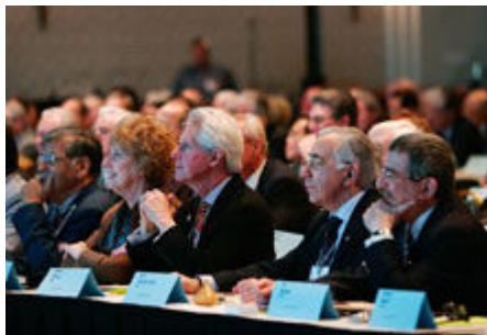
Rotarianos de todo o mundo se reúnem durante sessão plenária da Assembléia Internacional de San Diego – Califórnia – EEUU