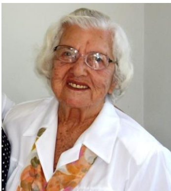
"Feliz Natal família rotária!"