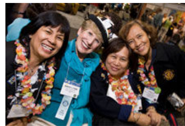
Rotarianos das Filipinas e dos EUA encontram-se no Centro de Confraternização da convenção do RI.

satisfação do rotariano. O novo sócio deve desde cedo integrar uma comissão de seu interesse, desempenhar alguma tarefa na reunião semanal ou participar de projeto de prestação de serviços. O envolvimento nos assuntos do clube contribui ao entrosamento de todos e aumenta o conhecimento sobre o Rotary.