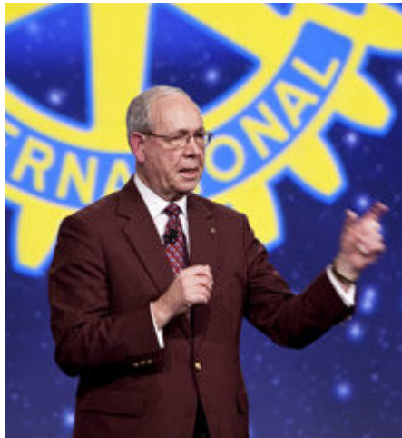
O presidente eleito do RI Ray Klinginsmith fala aos governadores eleitos na assembleia internacional de 2010.