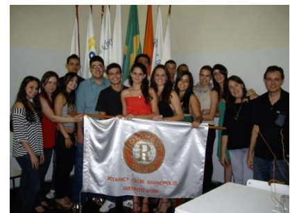
Rotaract Divinópolis comemora mais um ano de vida.