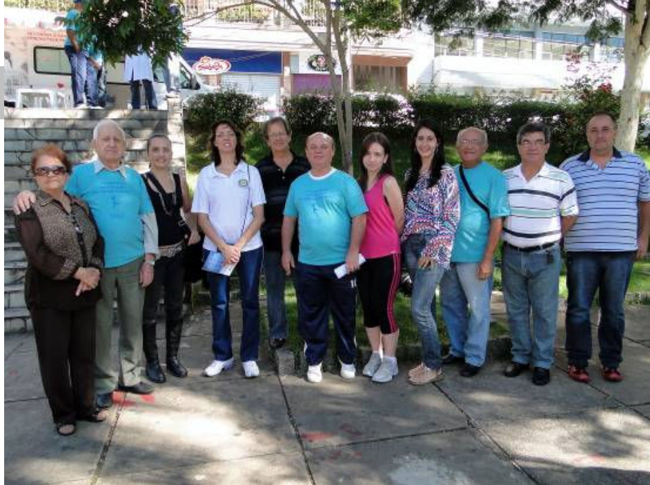
Turma do Leste durante evento na praça do Santuário