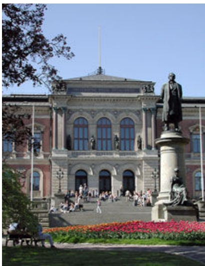
A Uppsala University, na Suécia, foi escolhida para sediar o novo Centro Rotary de Estudos Internacionais na área da paz e resolução de conflitos.

O Conselho de Curadores da Fundação Rotária selecionou a Uppsala University , na Suécia, para sediar o sétimo Centro Rotary de Estudos Internacionais na área da paz e resolução de conflitos.