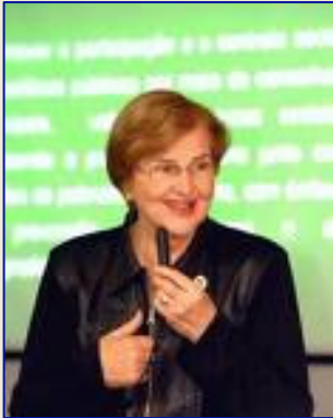
Zilda Arns Neumann