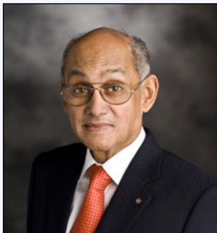
Presidente eleito Kalyan Banerjee

No dia 17 de janeiro o lema de 2011-12, Conheça a Si Mesmo para Envolver a Humanidade , foi anunciado pelo presidente eleito Kalyan Banerjee na Assembleia Internacional em San Diego, EUA.