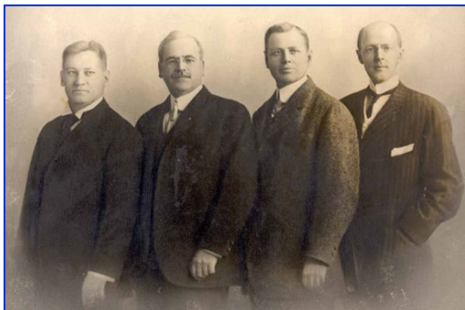
Os quatro primeiros rotarianos: Gustavus Loehr, Silvester Schiele, Hiram E. Shorey e Paul P. Harris

No dia 23 de fevereiro de 1905, Paul P. Harris, Gustavus Loehr, Silvester Schiele e Hiram E. Shorey se reuniram no escritório de Loehr para a ocasião que ficaria conhecida como a primeira reunião de Rotary Club.