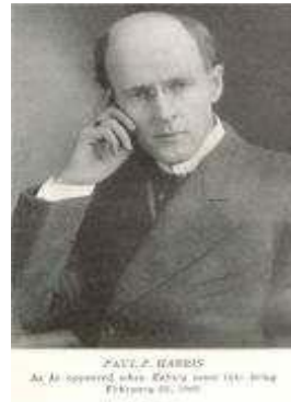
Foto de Paul Harris, na época da fundação do Rotary Club de Chicago