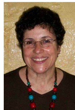
Sua esposa Lourdes