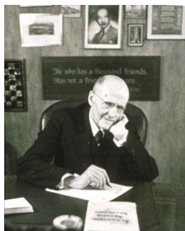
Escritório de RI em 1945 Evanston- Illinois

No mesmo ano foi formada a Associação Nacional de Rotary Clubs e Paul Harris foi eleito seu primeiro presidente, cargo que ocupou durante dois anos. No final de seu mandato, tornou-se presidente emérito e serviu como porta-voz da organização promovendo o crescimento de seu quadro social e prestação de serviços no mundo inteiro.