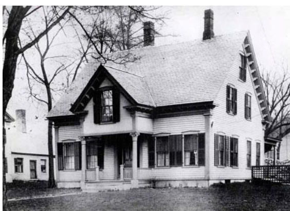
Casa em Wallingford, Vermont, EUA