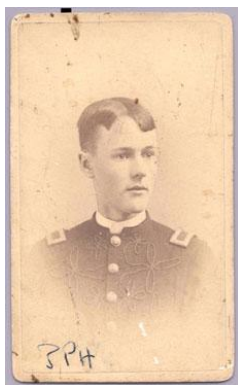
Cadete da Academia Militar de Vermont, 1886