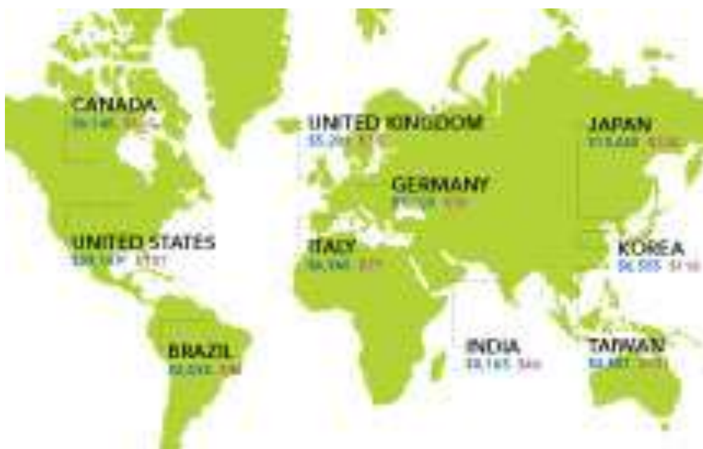
OS 10 MAIORES DOADORES

Definir metas de arrecadação é fundamental aos esforços da iniciativa Todos os Rotarianos, Todos os Anos e ajuda a verificar o andamento com relação a seu alcance. Como convencer os associados a doarem periodicamente ao Fundo Anual para Programas da Fundação?