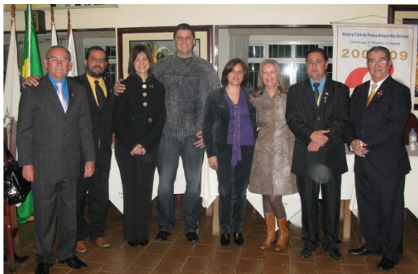
O Conselho Diretor empossado