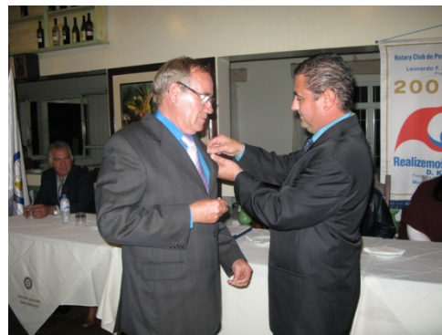
O momento solene da posse