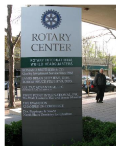
MARCO DEFRENTE O PRÉDIO