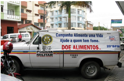
Nosso colaborador o 20° BPM

Vamos dar continuidade ao Programa "Alimente uma Vida", já agendado para o dia 11 de dezembro próximo.