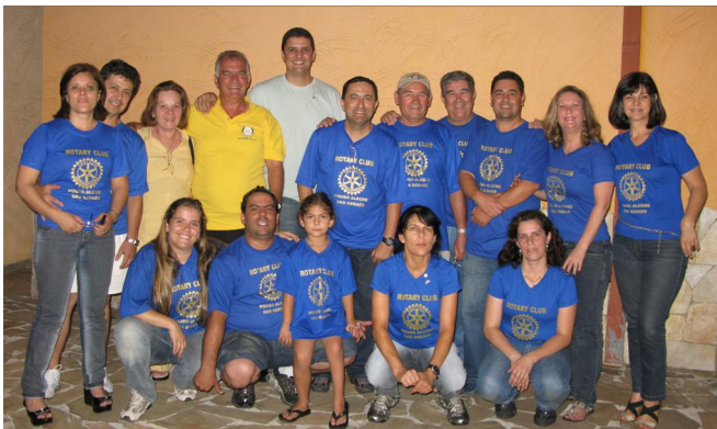
Os companheiros, após a missão cumprida .

Há anos esse interessante projeto vem sendo desenvolvido pelos companheiros, familiares e voluntários do Rotary Club Pouso Alegre-Das Geraes, ocasião em que todos se reúnem, durante todo um dia, com panfletos, solicitando doações de alimentos em supermercados de grande movimento na cidade. Os resultados têm sido gratificantes, beneficiando grande parte de comunidades carentes.