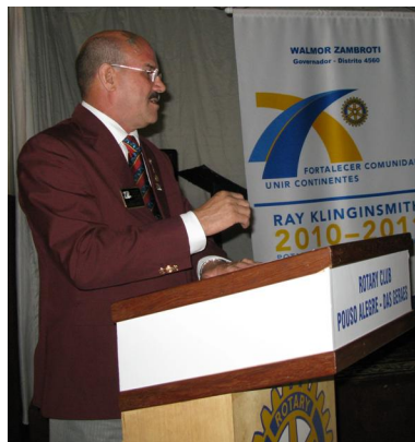
A mensagem do Governador