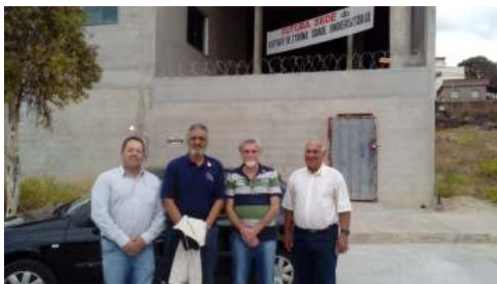
Visita ao local onde está sendo construída a sede do Rotary Itauna Cidade Universitária