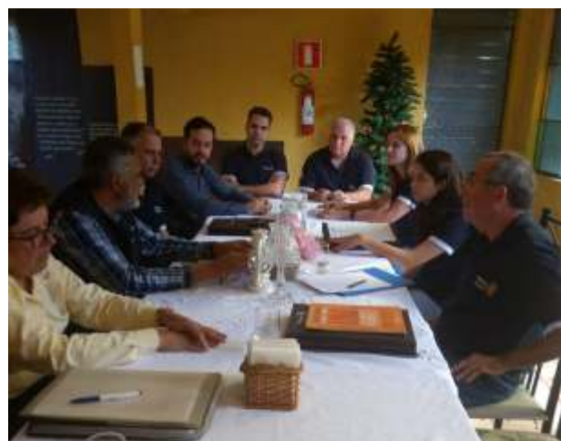
Assembleia do Rotary Itaúna