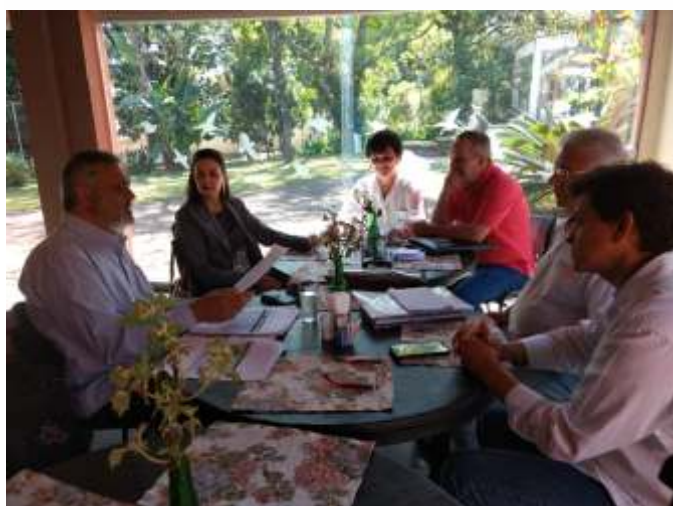
Reunião de trabalho com o Rotary Itaúna - Cidade Educativa