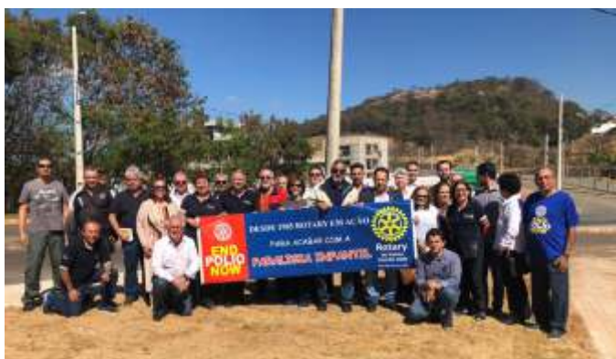
Chegada à Itaúna no dia 29/07/2019: Local onde será instalado o novo Marco Rotário.