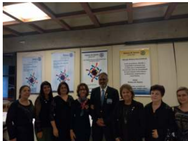
Presença das companheiras da ASR