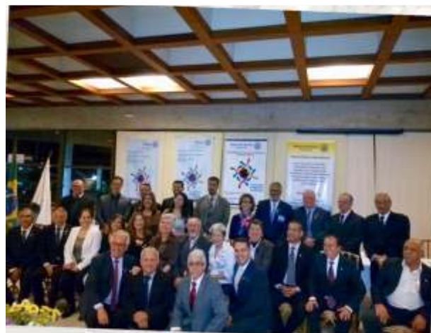
Companheiros do Rotary Itaúna