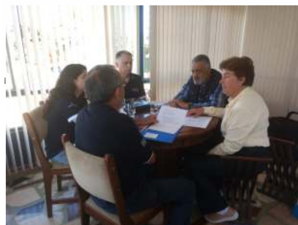
Reunião de trabalho com o Rotary Itaúna