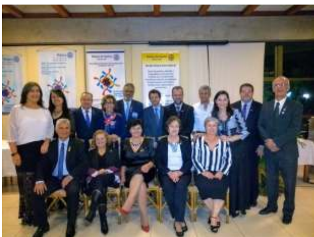
Companheiros do Rotary Itaúna