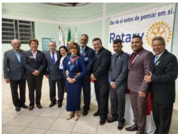
Companheiros do Distrito e o casal de governadores

Encerrada com louvores a visita do casal de governadores aos Clubes e Casa da Amizade de Itaúna, com uma festividade cheia de alegria e gratidão. Breve estaremos juntos outra vez.