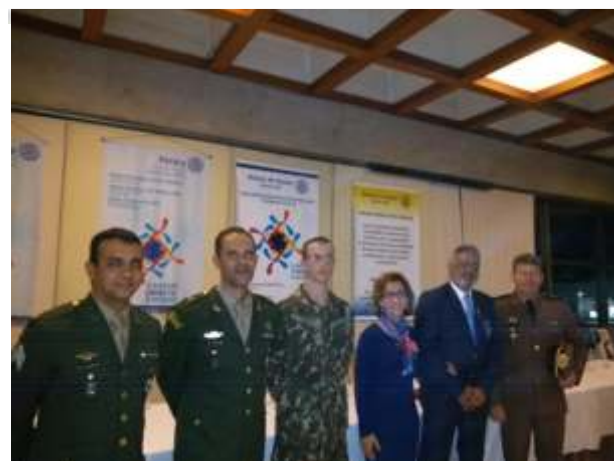
Tiro de Guerra de Itaúna e o casal de governadores