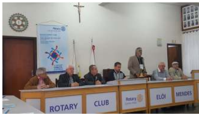
As companheiras da ASR marcando presença no Seminário Setorial da Área 2