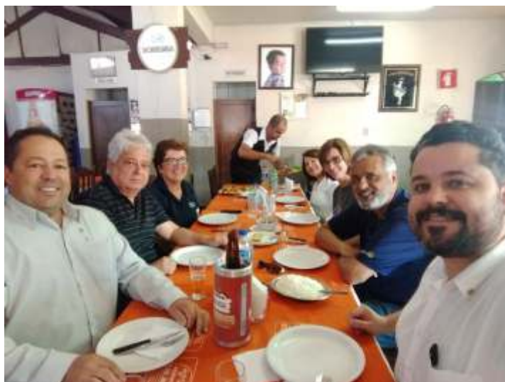
Rotary Itauna Cidade Universitária em almoço com o governador na Churrascaria do Trevo