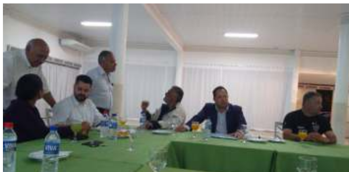
Assembleia do Rotary Itaúna Cidade Universitária