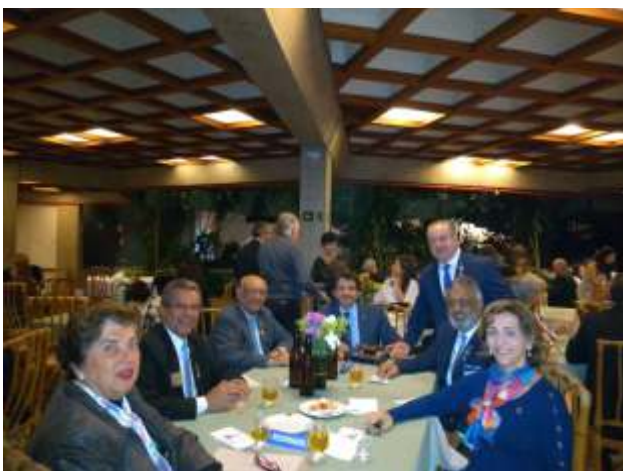
Companheiros do Distrito e o casal de governadores