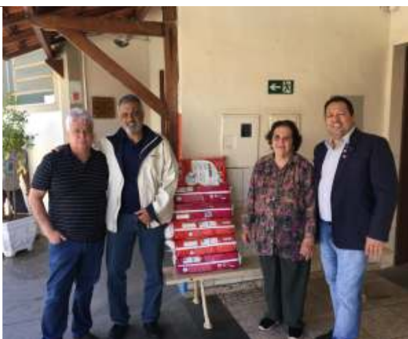
Doação de fraldas para o asilo Frederico Ozanan