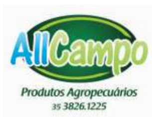
Rotary Club Lavras Sul