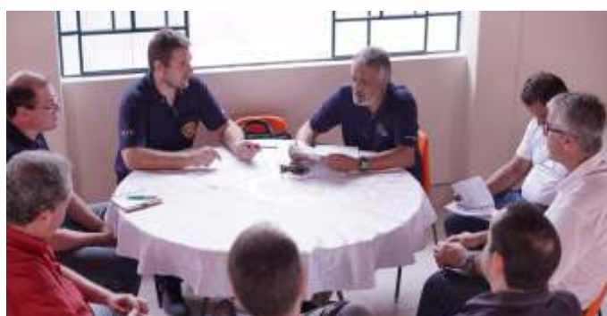
Visita ao Hospital Nossa Senhora da Piedade, beneficiário em projeto de subsídio do Rotary Internacional.