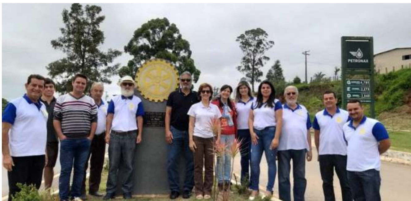
Chá da Amizade com as companheiras da Casa da Amizade de São Tiago.