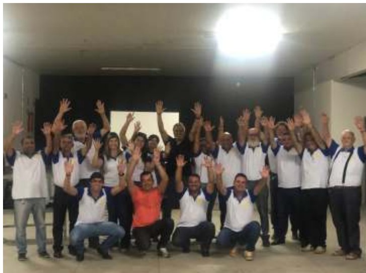
Assembléia do RC de São Tiago