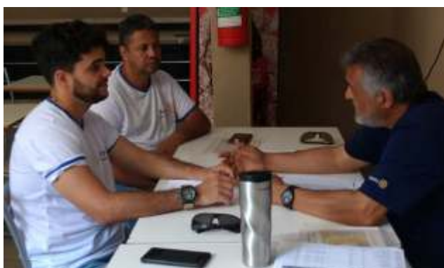
Reunião de trabalho com a equipe do RC de Pains.

Festiva comemorativa no RC. de Pains. Teve até parabens com pipoca para comemorar o aniversário do Governador Paulo!