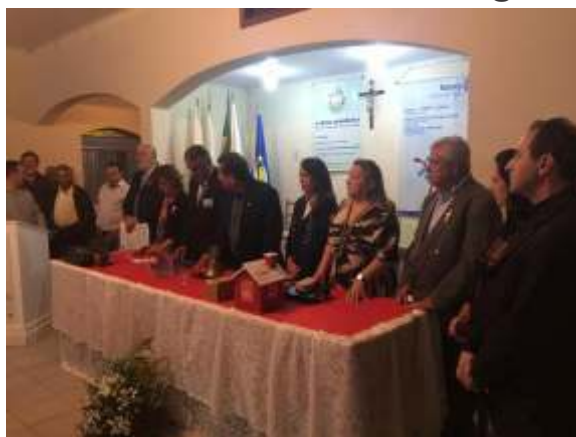
Festiva do RC.de São Tiago.