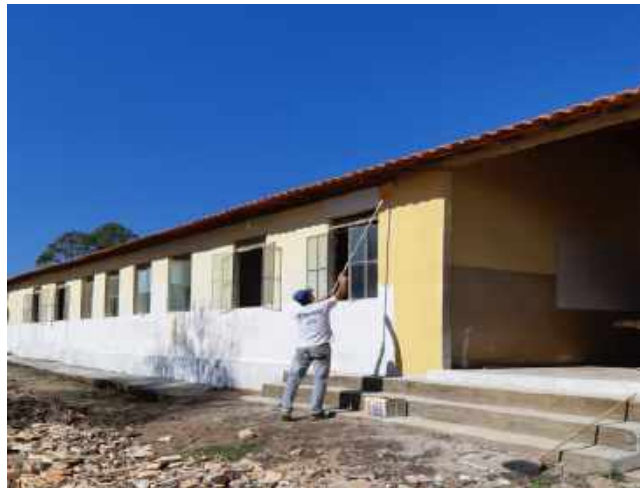
Pintura da Escola Estadual de Corguinhos patrocinada pelo NRDC/Corguinhos e Rotary