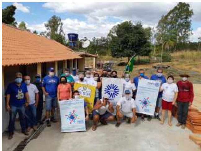
Membros do NRDC de Corguinhos e do Rotary Club de Iguatama junto com demais parceiros envolvidos na reforma da Escola estadual de Corguinhos.