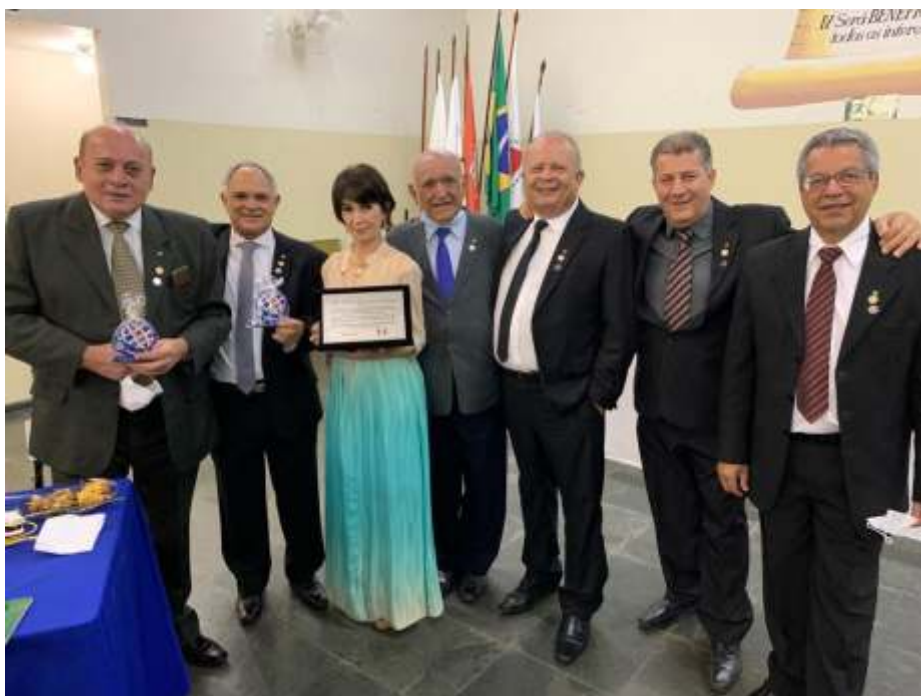
Rotary de Divinópolis Leste