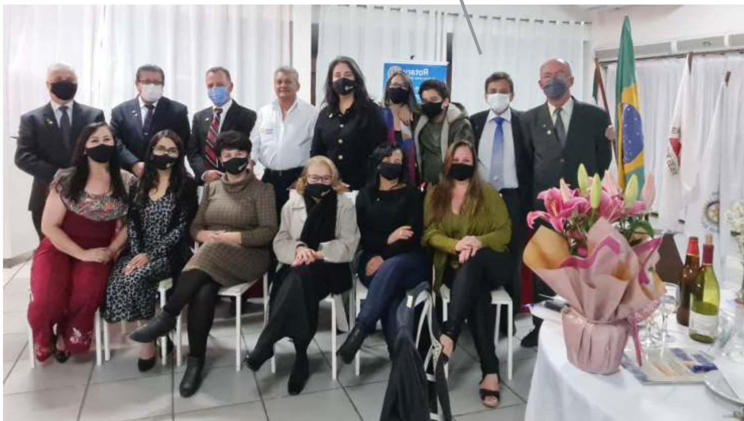
Rotary de Itaúna Cidade Educativa