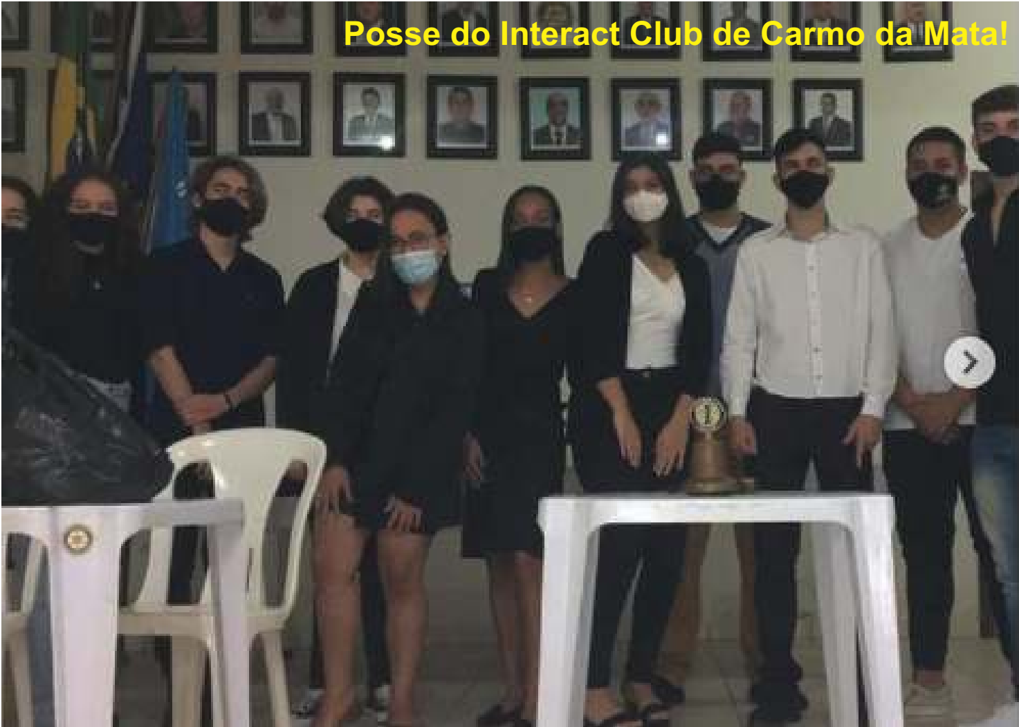
Posse do Interact Club de Carmo da Mata!