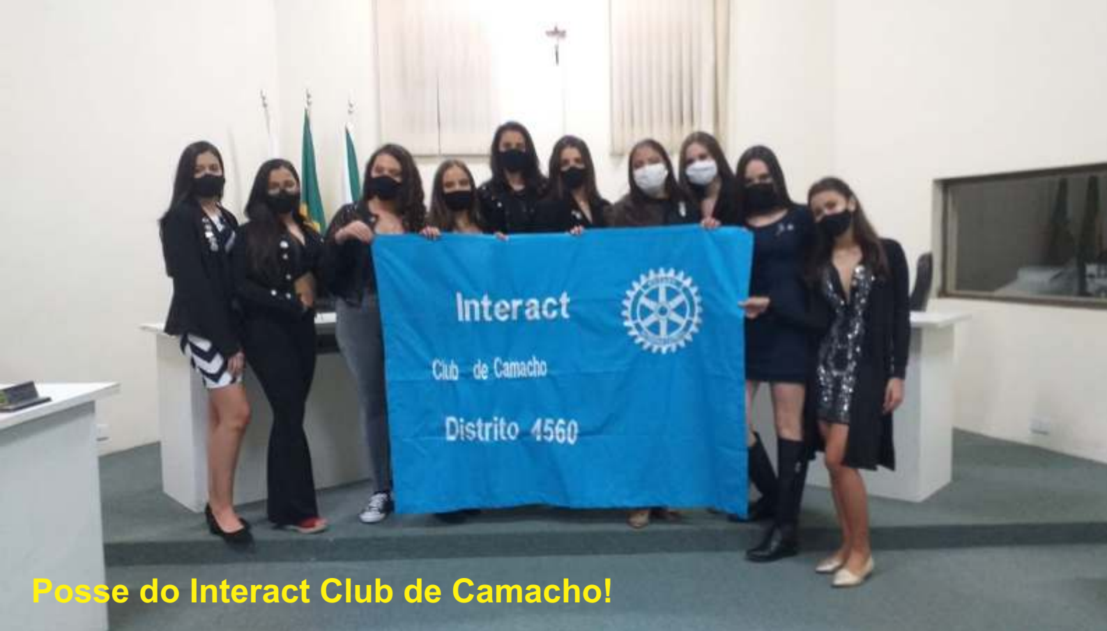
Posse do Interact Club de Camacho!