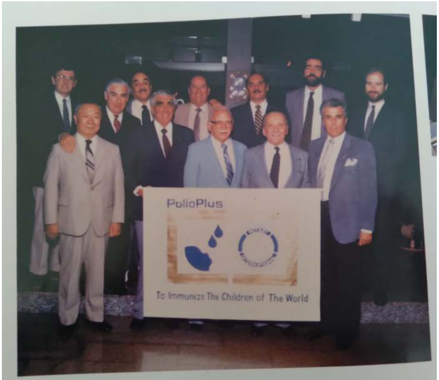
Foto do lançamento a Campanha Pólio Plus

Fonte: Memórias da PolioPlus no Brasil / Comissão Nacional PolioPlus - Belo Horizonte. Ed. Cuatiara, 1996