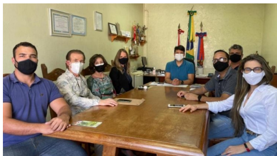
Reunião com o Prefeito Municipal de Formiga em 18/8/2021.

https://www.rotary4560.org.br/porta/relatorio-semester-formiga/