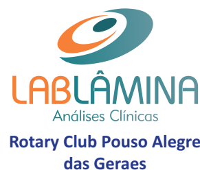
Rotary Club Pouso Alegre das Geraes