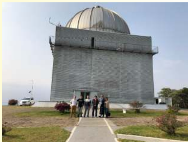
Visita ao Obsetório no Pico de Dias em Brasópolis