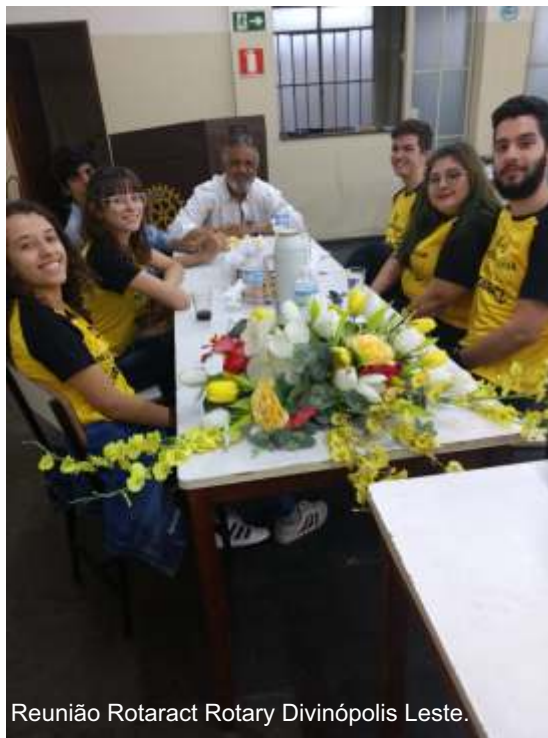
Reunião Rotaract Rotary Divinópolis Leste.