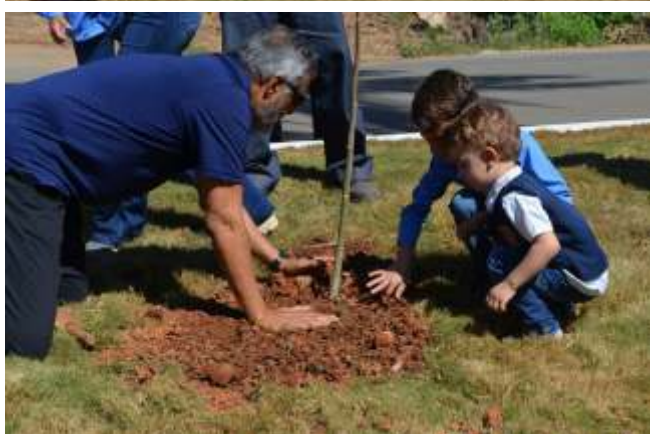
Festiva encerrando a visita com muito entusiasmo!