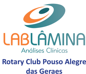
Rotary Club Pouso Alegre das Geraes