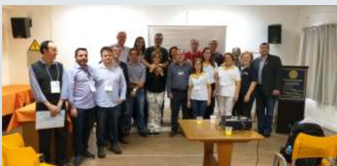
Governador Antônio Elcio