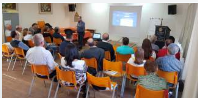
Governador Ângelo Freitas