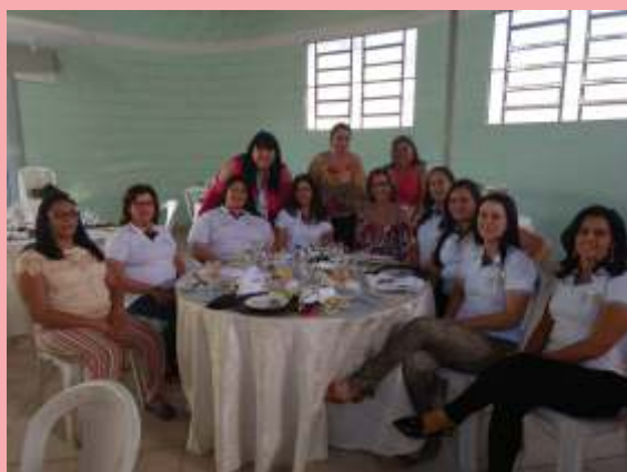
Delicioso Chá Casa da Amizade!!