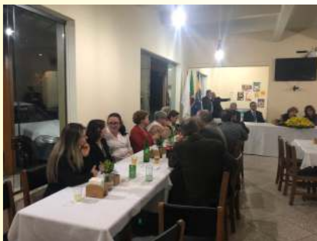
Jantar festivo Brasópolis