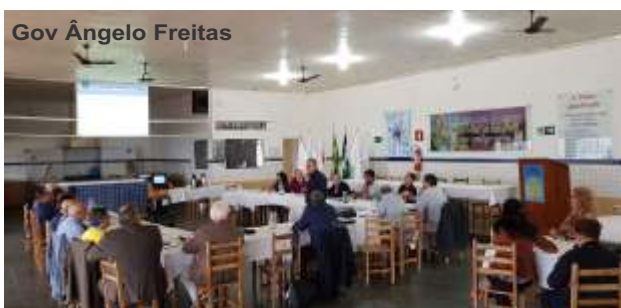
Gov Ângelo Freitas