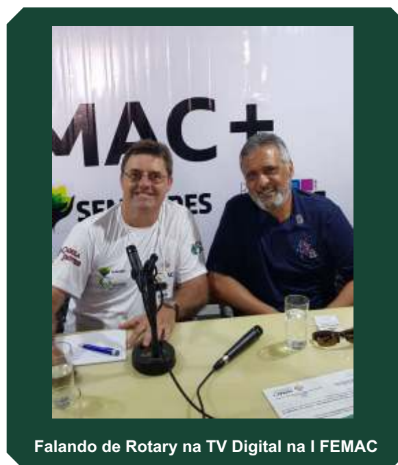
Falando de Rotary na TV Digital na I FEMAC