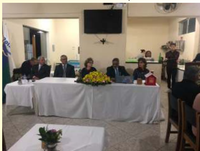
Jantar festivo Brasópolis