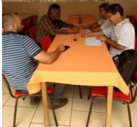
Visita ao Projeto Rocinha, onde o Rotary é parceiro