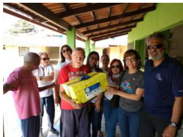
Visita ao Asilo onde a Casa da Amizade doou meias aos idosos.