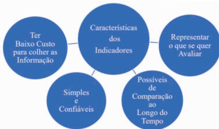
Figura 1: Características que Devem Conter um Indicador. Fonte: CAPTA (2021) 3 .

A aplicação dos critérios requer, formas específicas de operacionalização, ou seja, devem ser calculadas a partir da identificação e quantificação dos resultados obtidos. Em geral, “indicadores” são utilizados. Os indicadores vão possibilitar que o avaliador tenha uma ideia “mais concreta” das transformações propostas pelo projeto. Não é uma tarefa fácil definir os indicadores, todavia, algumas características devem conter (Figura 1).